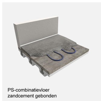
PS-combinatievloer zandcement gebonden