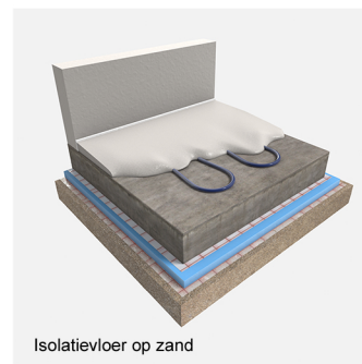
Isolatievloer op zand