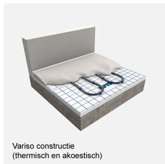
Variso constructie (thermisch en akoestisch)