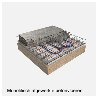
Monolithisch afgewerkte betonvloeren