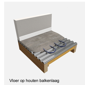
Vloer op houten balkenlaag