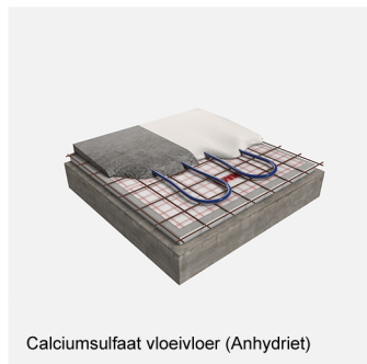
Calciumsulfaat vloevloer (Anhydriet)