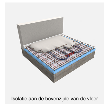
Isolatie aan de bovenzijde van de vloer