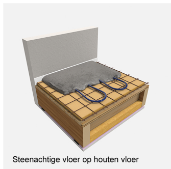
Steenachtige vloer op houten vloer