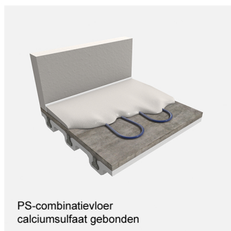
PS-combinatievloer calciumsulfaat gebonden