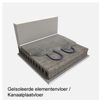
Geïsoleerde elementenvloer / Kanaalplaatvloer